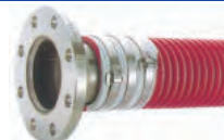
谷埋めフープバンド締 (JISフランジ付き)