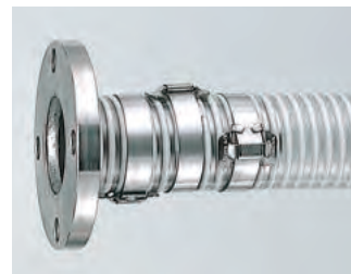
フープバンド締め (ステンレス製 JIS フランジ付き)